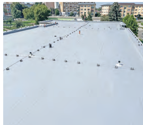
Zníženie energetickej náročnosti budovy MŠ Komenského B v Seredi - Zateplenie strešného pláňa. Mesto tu preinvestovalo 58 770,91 eur.