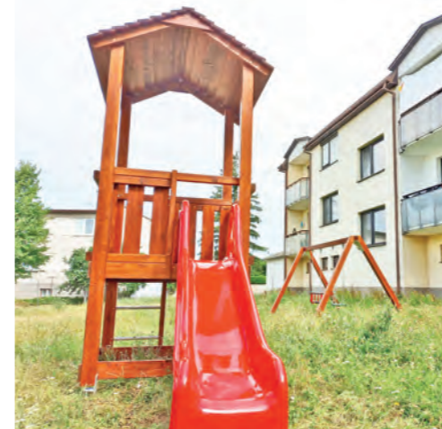
Nové hracie prvky boli osadené na ihriskách na ulici Čepeňská a Mlynárska. Prvky boli doplnené do lokalít, odkiaľ mestu prišlo od obyvateľov najviac podnetov. Cena za šesť nových kusov bola takmer 10-tisíc eur.