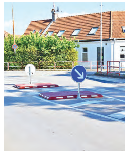
Moderný cestný ostrovček s bezbariérovým príchodom pre chodcov na Čepeňskej ulici v časti pri Pekárskej. Realizácia stála 9 936 eur a zahŕňa osvetlenie príchodu, bezbariérovosť, vodorovné a zvislé dopravné značenie vrátane cestných ostrovčekov a reflexných prvkov na ceste.