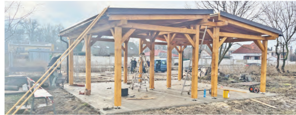
Nový altánok v areáli štadióna. Z grantu Ministerstva investícií, regionálneho rozvoja a informatizácie SR získala Sereď vyše 290-tisíc eur na obnovu svojich štyroch, verejných prístupných, športovísk. Spolu s desaťpercentným kofinancovaním z rozpočtu mesto v projekte preinvestuje až 320-tisíc eur. Vynovia sa lokality v Hornom Čepeni, na Spádovej, aj časť areálu futbalového štadióna.