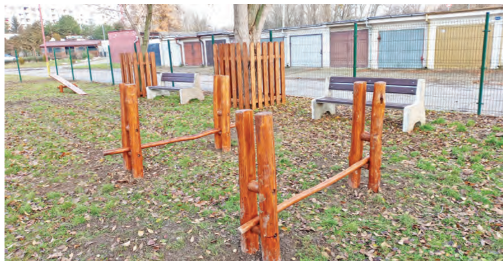
Na podnety obyvateľov mesto vytvorilo ďalší psí výbeh, vznikol na Novomestskej ulici. Investície mesta na realizáciu boli vo výške 8920,50 eur, umiestnené agility prvky pre psov v hodnote 3200 eur venoval sponzor spoločnosť Samsung.