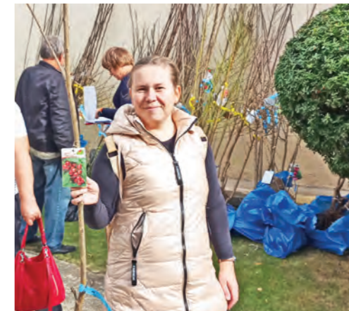
Obyvatelia Serede mohli mestský úrad požiadať o mladé stromčeky ovocných druhov do svojich záhrad. Tie im už boli rozdane v druhej polovici októbra. Suma za nákup 140 kusov stromov bola 1369,24 eur. V rámci verejnej zelene bolo tento rok vysadených spolu 106 kusov stromov v celkovej hodnote 11672,04 eur.