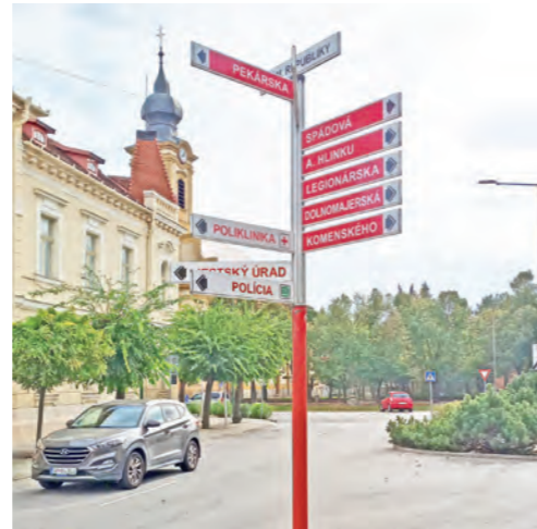
Obnovený informačno – navigačný systém mesta. V prvej fáze bola obnovená časť v celkovej hodnote 11 829,60 eur a obnovených bolo spolu 318 tabuliek.