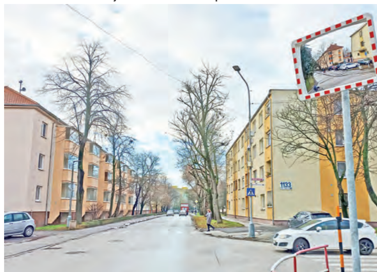
V meste pribudli tri nové vypuklé zrkadlá.

dopravného značenia sú potrebné priaznivé poveternostné podmienky, tak k nim pristúpime v budúcom roku hneď, ako to počasie dovolí. Aktuálne sú teda v meste osadené len zvislé značenia, teda dopravné značky,“ vysvetlil Klinka. Zákaz prejazdu nákladných automobilov cez komunikáciu pribudne na ceste od Horného Čepeňa smer Nový Majer.