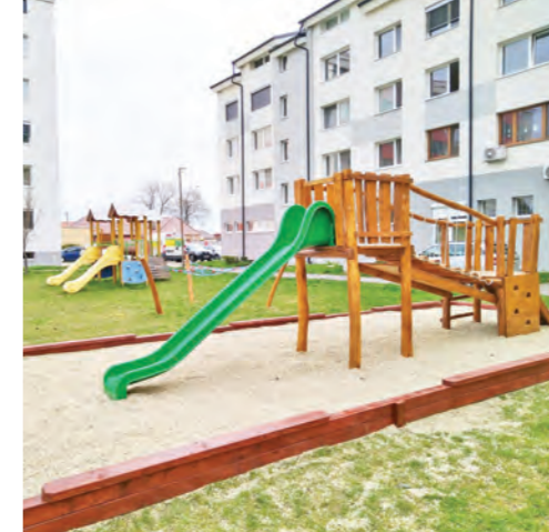
Spoločnosť Samsung sa postarala o nové ihrisko na ulici Andreja Hlinku. Za 20-tisíc eur vďaka nemu mesto osadilo do vnútrobloku pre deti osem hracích prvkov.