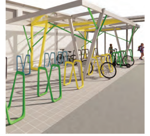
Deti a zamestnanci zo ZŠ J. A. Komenského a tiež z Cirkevnej ZŠ sv. Cyrila a Metoda v Seredi dostanú krásny moderný priestor na bezpečné odkladanie bicyklov. Ministerstvo dopravy a investícií SR na vybudovanie štýlového polokrytého cykloprístrešku prispelo sumou 30-tisíc eur.