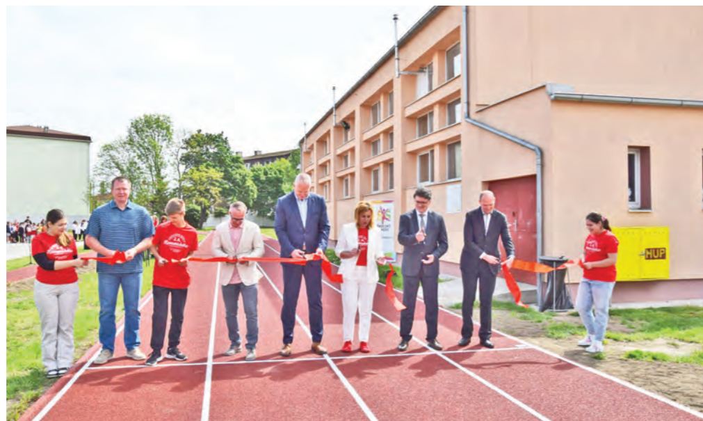
Bežecký ovál na ZŠ J. A. Komenského. Celkové náklady na projekt 159 510,88 eur z toho vlastné finančné prostriedky mesta 75 703,35 eur.