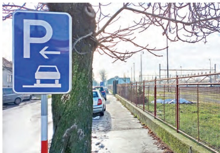
Na Železničnej ulici vzniklo dočasné parkovanie na chodníkoch.

rieši radnica napríklad aj na ulici A. Hlinku a Komenského, kde pribudne nový priebeh pre chodcov a taktiež nastane zmena organizácie dopravy v križovatke ulice Komenského a ulice Hornomajerská. „Nakoľko pri maľovaní vodorovného