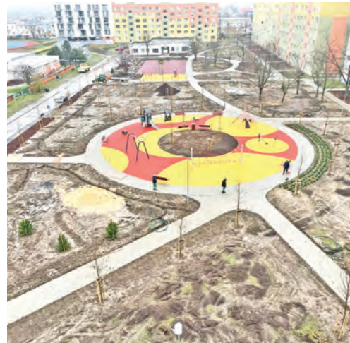
Revitalizácia vnútrobloku na ulici D. Štúra II a na Garbarskej ulici. Dve súbežne realizované obnovy sídliskových vnútroblokov mesto financuje z externých zdrojov v celkovej hodnote viac ako 1,4 milióna eur.