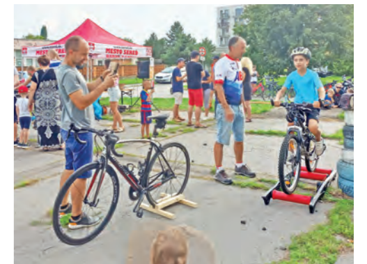
Športové štvrtky spestrili a obohatili seredské leto. Pod taktovkou koordinátora práce s mládežou mesta Sereď sa od júla do septembra uskutočnilo desať podujatí, ktoré prilákali mladých ľudí, aj rodiny s deťmi. Mesto takto poskytlo priestor a čas pre zmysuplné trávenie voľných letných chvíľ.

• Projekt s názvom Poskytovanie opatrovateľskej služby v meste Sereď hradil služby spojené s opatrovateľskou službou v roku 2023 v celkovej hodnote 225 925 eur, čo sú zdroje, ktoré vďaka externým zdrojom šetrili mestský rozpočet. Celkovo bolo od roku 2021 za 22 mesiacov projektu na účet mesta v rámci tohto projektu poukázaných až 375 103 eur.