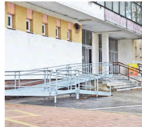
Dom kultúry Sereď získal takmer 190-tisíc eur z externých zdrojov na skvalitnenie, modernizáciu a bezbariérovosť knižnice. Aktuálne sa v rámci projektu zrealizovalo osadenie vstupnej rampy do budovy a vybudovala sa automatická plošina pre ZŤP osoby.