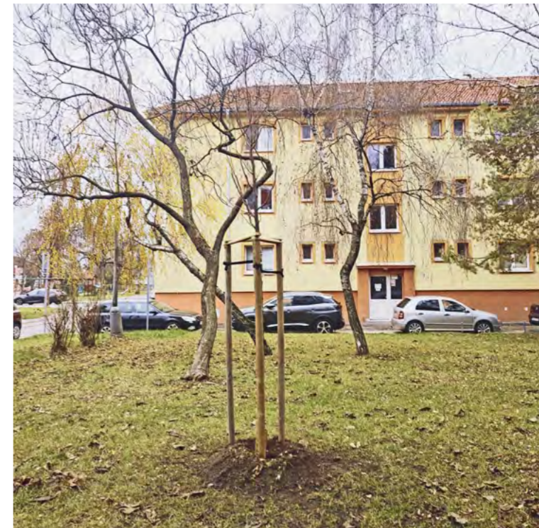
Stromy skrášľia aj sídlisko na Spádovej ulici a na ulici A. Hlinku.

Výsadba je financovaná z časti prostriedkov, ktoré mesto získalo od investora výstavby nového mesta. „Pri jeho búraní muselo byť totiž vyrúbaných viacero stromov. Finančné prostriedky