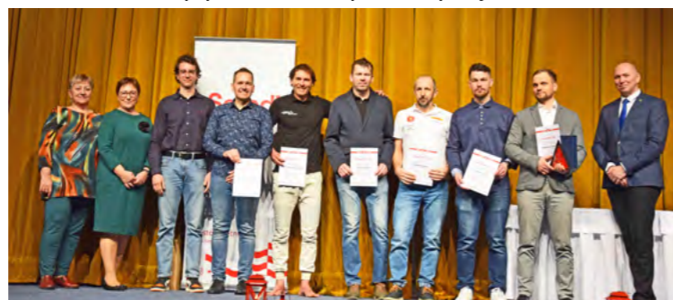
Aj kolektív ŠK CYKLO-TOUR SEREĎ bol medzi ocenenými športovcami.