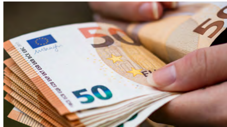
Ilustračná foto, freepik.com

eRko - Hnutie kresťanských spoločenstiev detí – 2 867 eur (6 000 eur), KC PRIESTOR – 4 756 eur (7 200), Komunita Eden – 6 178 eur (16 000), Life is Perfect – život je perfektný – 2 700 eur