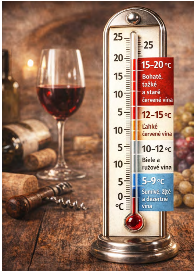
Odporúčané teploty podávania jednotlivých druhov vína.

Intoxikácia alkoholom je definovaná ako hladina alkoholu v krvi v 100 mg/dl (promile). Hladina alkoholu klesá o 15–20 mg/dl za hodinu. Metabolizmus každého človeka je individuálny. Priemerne