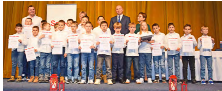
Najmladšími ocenenými športovcami boli malí futbalisti z prípravky U9 z ŠKF Sereď.