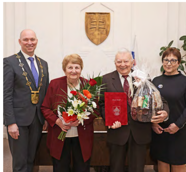
Manželia Krajčovi boli ocenení vedením mesta Sereď pri príležitosti Národného týždňa manželstva.