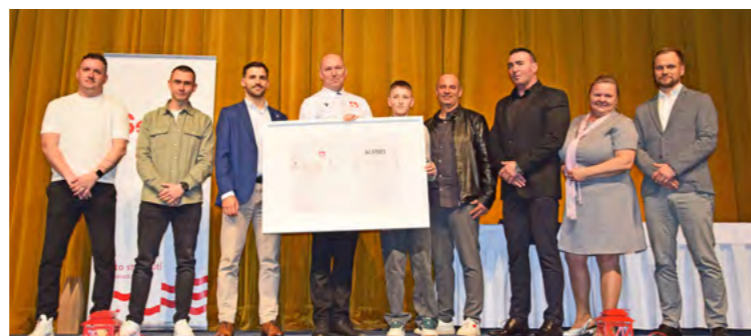
Športovci venovali primátorovi mesta tričko so svojimi podpismi, ktoré má pripomínať budúce spoločné úspechy.