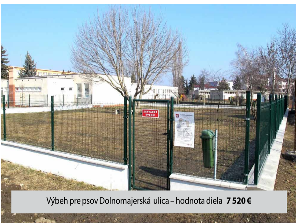
Výbeh pre psov Dolnomajerská ulica – hodnota diela 7 520 €