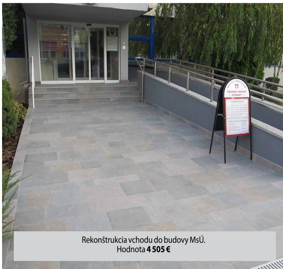
Rekonštrukcia vchodu do budovy MsÚ. Hodnota 4 505 €