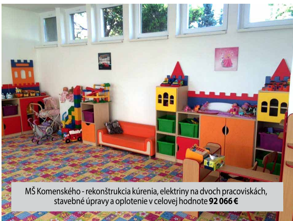
MŠ Komenského - rekonštrukcia kúrenia, elektriny na dvoch pracoviskách, stavebné úpravy a oplotenie v celovej hodnote 92 066 €