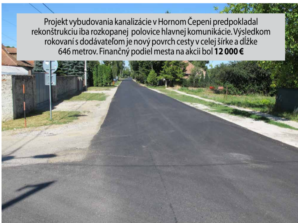
Projekt vybudovania kanalizácie v Hornom Čepeni predpokladal rekonštrukciu iba rozkopanej polovice hlavnej komunikácie. Výsledkom rokovani s dodávateľom je nový povrch cesty v celej šírke a dĺžke 646 metrov. Finančný podiel mesta na akcii bol 12 000 €