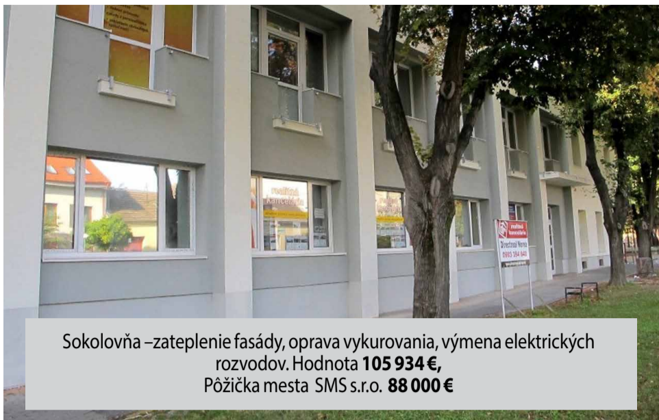
Sokolovňa –zateplenie fasády, oprava vykurovania, výmena elektrických rozvodov. Hodnota 105 934 € , Pôžička mesta SMS s.r.o. 88 000 €