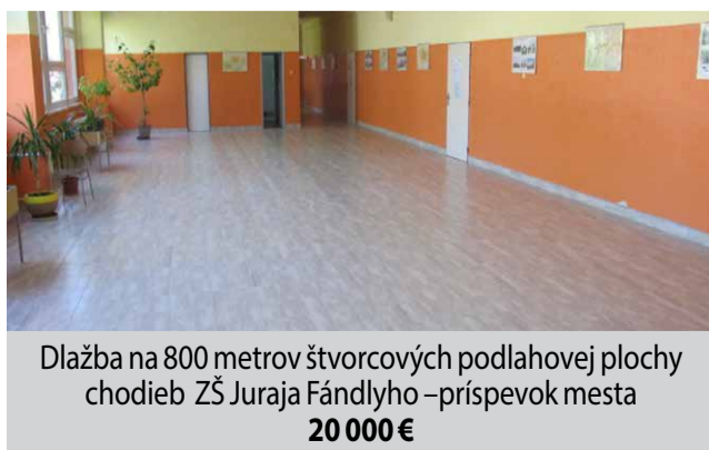
Dlažba na 800 metrov štvorcových podlahovej plochy chodieb ZŠ Juraja Fándlyho – príspevok mesta 20 000 €