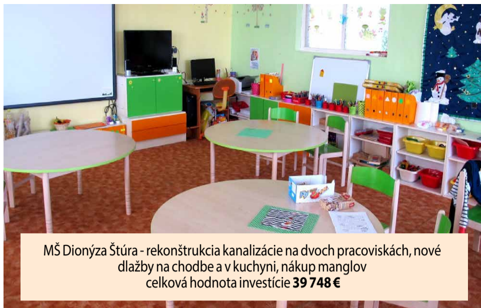
MŠ Dionýza Štúra - rekonštrukcia kanalizácie na dvoch pracoviskách, nové dlažby na chodbe a v kuchyni, nákup manglov celková hodnota investície 39 748 €