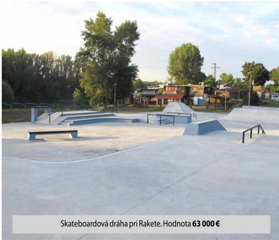
Skateboardová dráha pri Rakete. Hodnota 63 000 €