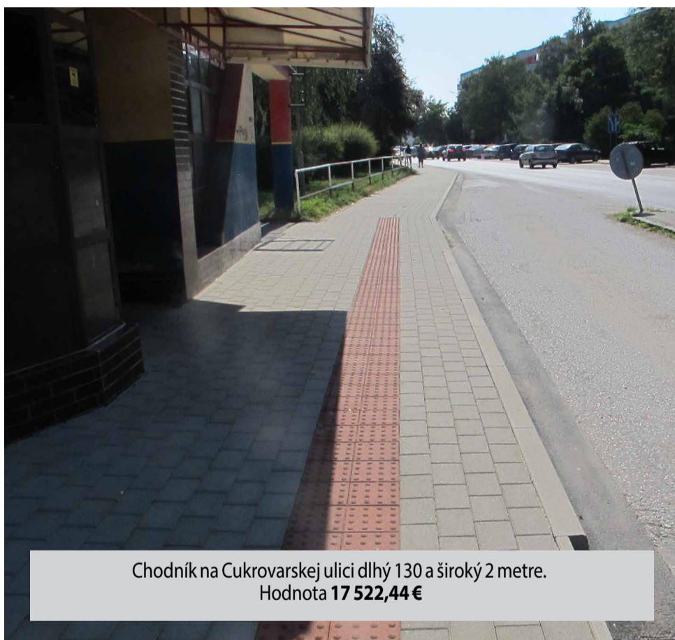
Chodník na Cukrovárskej ulici dlhý 130 a široký 2 metre. Hodnota 17 522,44 €