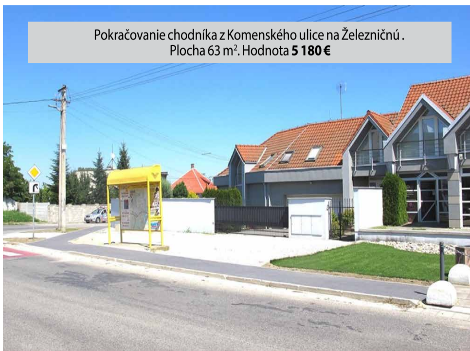
Pokračovanie chodníka z Komenského ulice na Železničnú. Plocha 63 m 2 . Hodnota 5 180 €