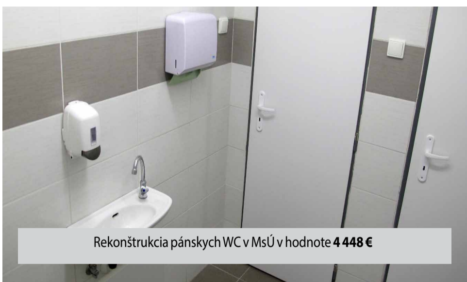
Rekonštrukcia pánskych WC v MsÚ v hodnote 4 448 €