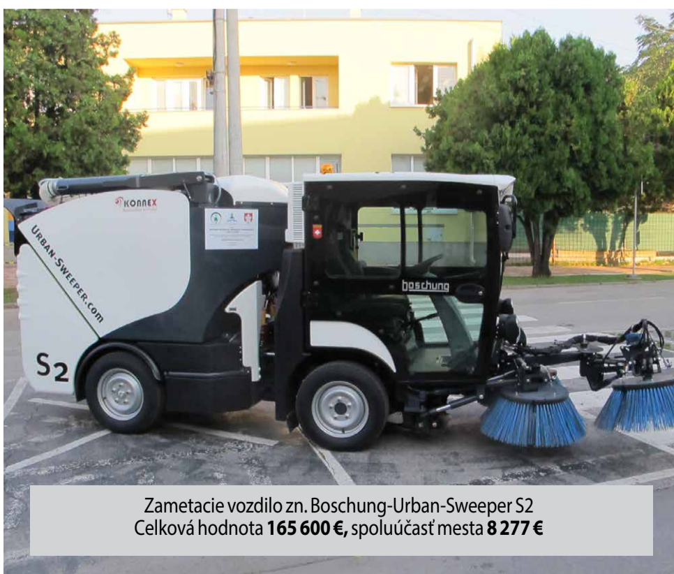
Zametacie vozidlo zn. Boschung-Urban-Sweeper S2 Celková hodnota 165 600 € , spoluúčasť mesta 8 277 €