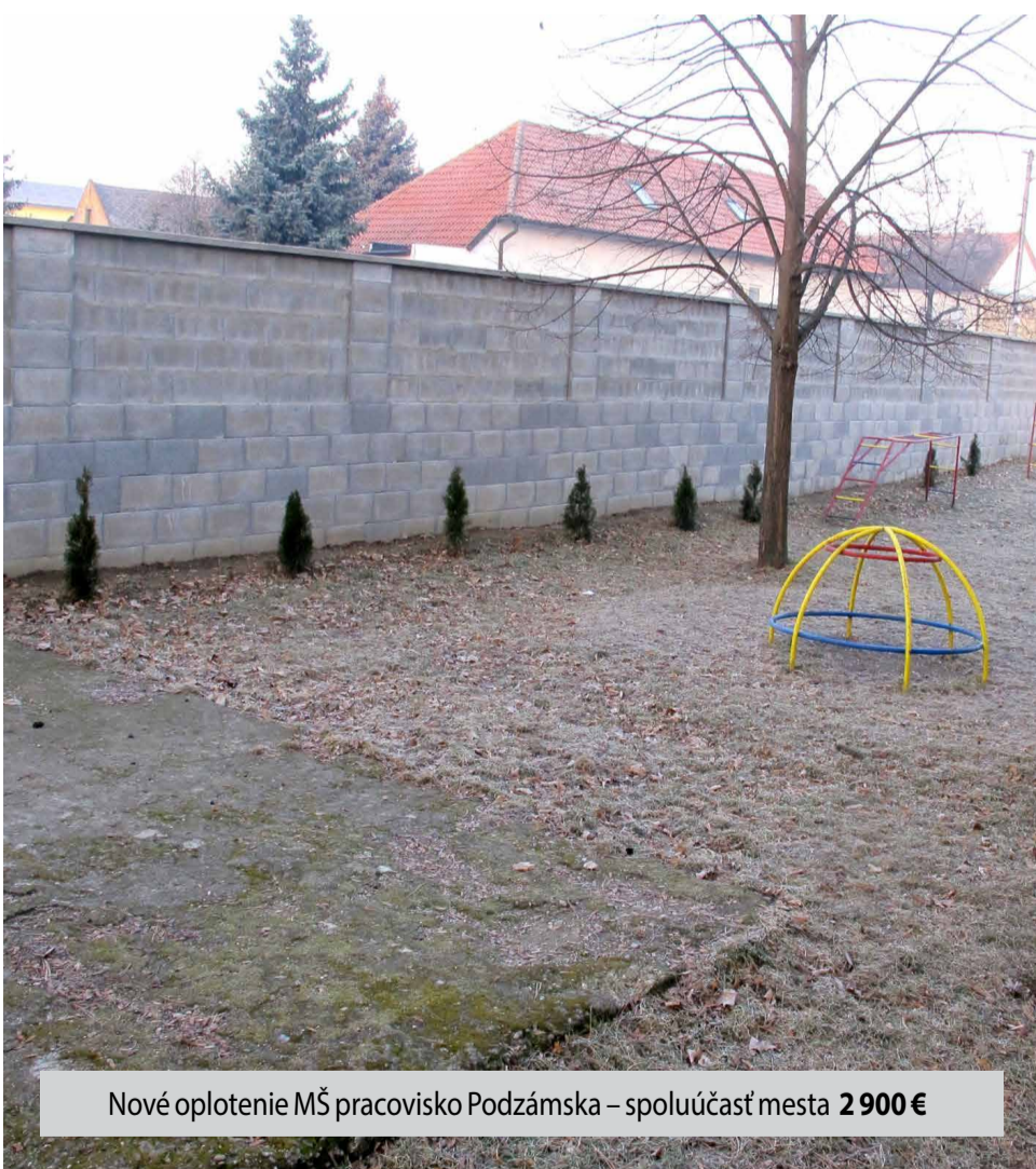
Nové oplotenie MŠ pracovisko Podzámska – spoluúčasť mesta 2 900 €