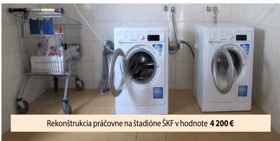
Rekonštrukcia práčovne na štadióne ŠKF v hodnote 4 200 €

Odpočet práce samosprávy za prvú polovicu volebného obdobia Prezentácia 28. 2. 2017 o 17. hodine v zasadačke mestského úradu