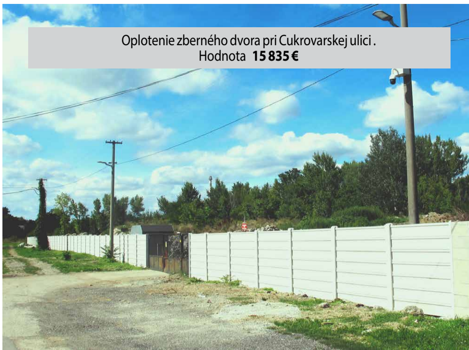
Oplotenie zberného dvora pri Cukrovarskej ulici. Hodnota 15 835 €