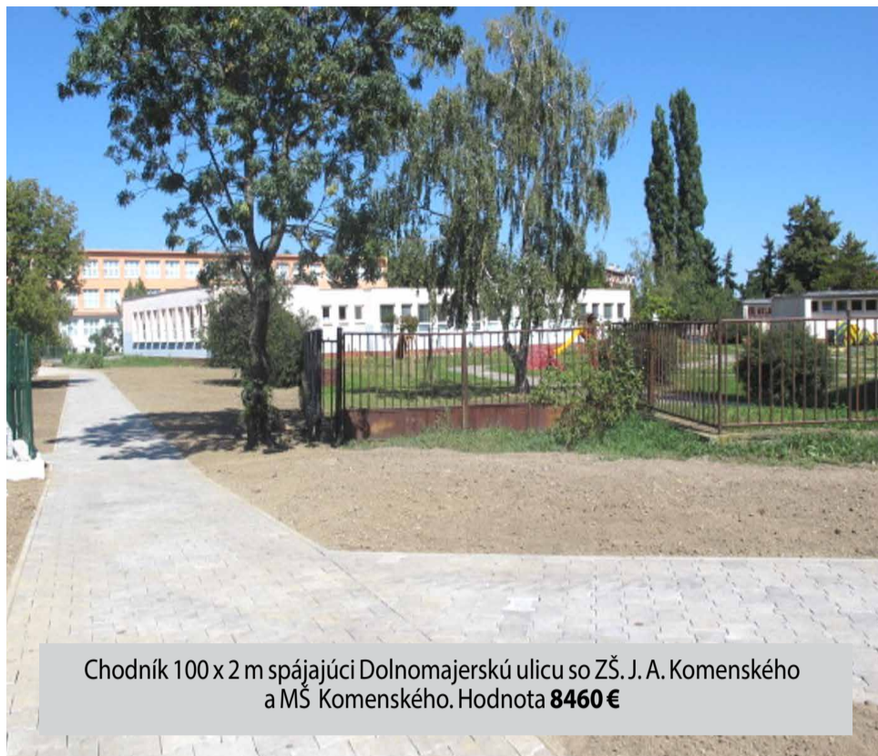
Chodník 100 x 2 m spájajúci Dolnomajerskú ulicu so ZŠ. J. A. Komenského a MŠ Komenského. Hodnota 8460 €