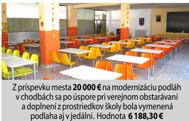
Z príspevku mesta 20 000 € na modernizáciu podláh v chodbách sa po úspore pri verejnom obstarávaní a doplnení z prostriedkov školy bola vymenená podlaha aj v jedálni. Hodnota 6 188,30 €