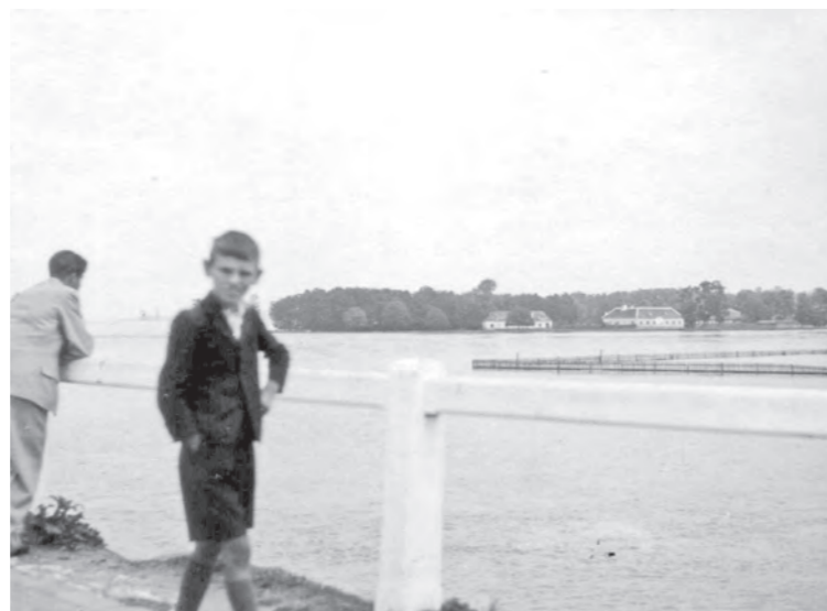
Povodeň v 20. rokoch 20. storočia, pohľad od cesty zo Šintavy na seredskú stranu, v pozadí vľavo žandárska stanica a vpravo starý hostinec.

V roku 1920 sa zmenšil obvod žandárskej stanice v Seredi, lebo bola zriadená stanica aj v Majcichove. Do tejto služobne patrili obce Majcichov, Gest (Hoste), Abrahám, Pald (Pavlice), Voderady, Opoj, Farkašín (Vlčkovce), Kerestúr (Križovany). Z roku 1921 sú v knihe zmienky o nepokojoch robotníkov v Novom Majeri a Malom Háji. Na veľkostatku vypukli štrajky, prostredníctvom ktorých zamestnanci žiadali vyššie mzdy. Žandári riešili aj krádeže uhlia, koks a dreva na železničnej stanici, z ktorých boli usvedčení mladí ľudia, ale obvinení boli aj obchodníci, ktorí tovar od zlodějov odkúpili. Nešťastná tragická udalosť sa udiala vo Valtašúre 5. mája 1921. Na poli pri obci našli deti nevybuchnutý granát, ktorý si ako hračku priniesli domov, kde vybuchol. Jeho následkom prišli 4 chlapci o život a jeden bol ťažko poranený. Chlapci boli z jedného dvora z dvoch rodín. V tom istom roku kronika popisuje sčítanie domov a ľudí, v Seredi 448 domov (skr. dom.), 5127 obyvateľov (skr. obyv.), Dolný Čepeň 44 dom., 343 obyv., Stredný Čepeň 52 dom., 340 obyv., Horný Čepeň 27 dom., 352 obyv., Valtašúr 95 dom., 600 obyv., Veľké Šúrovce 129 dom., 834 obyv., Zemianske Šúrovce 37 dom., 257 obyv., Varrašúr 69 dom., 440 obyv. Plocha celého obvodu bola 60 km 2 , na 1 km pripadalo 144 obyvateľov, z toho 88 % Slovákov a 12 % Maďarov. Do obvodu žandárskej stanice v Seredi patrili notariáty v Seredi, Dolnom Čepeni a Veľkých