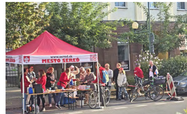
Vôňa kávy, úsmevy a bicykle. Mesto vystrojilo raňajky pre tých, ktorí autá nechali doma.

Podujatie prilákalo približne sto účastníkov, ktorí si pri káve a raňajkách vymenili dojmy a podporili myšlienku kampane. Mestské raňajky sa konali súčasne vo viacerých