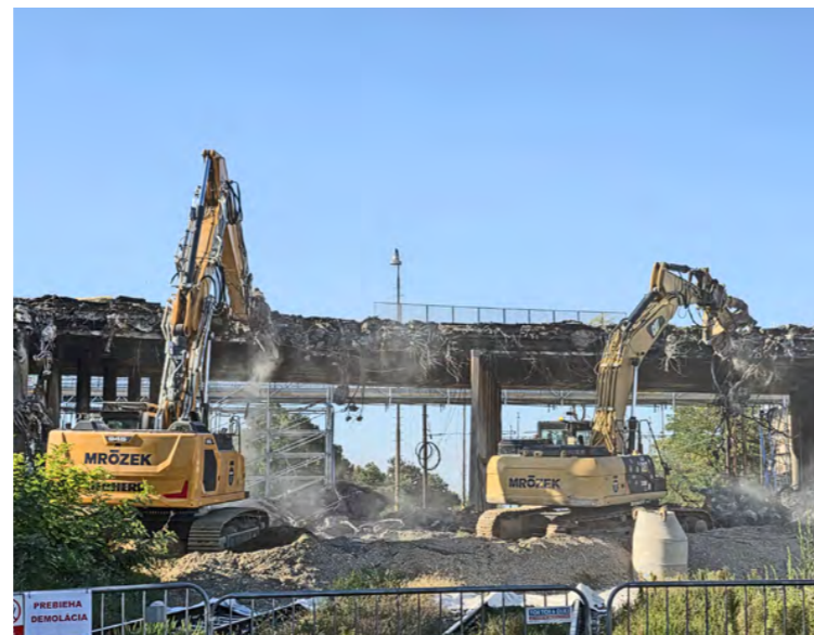
Búracie práce na moste sa začali v stredu 3. septembra.

V stredu 3. septembra 2025 sa mosta chopili ťažké stroje. Pešia lávka bola na tri dni uzavretá