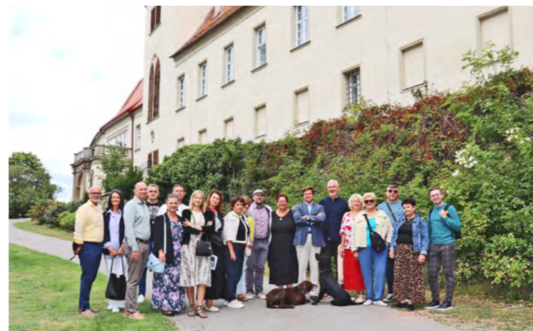
Tišnov predstavil svojim hosťom lokálne klenoty. Zámok v blízkej Lomnici sa po rokoch vrátil do správy pôvodného šľachtického rodu Thienen-Adlerflycht.

Vzťahy medzi mestami trvajú viac než dvadsať rokov a prinášajú projekty v oblasti škôl, kultúry aj priateľských väzieb. Program zahŕňal návštevu historického Doubravníku a kostola Povýšení sv. Kříže, prehliadku veteránov, návštevu zámku Thienen-Adlerflycht a vynoveného amfiteátra. Tišov predstavil rekonštrukciu námestia. „Aj my v Sereďi revitalizujeme