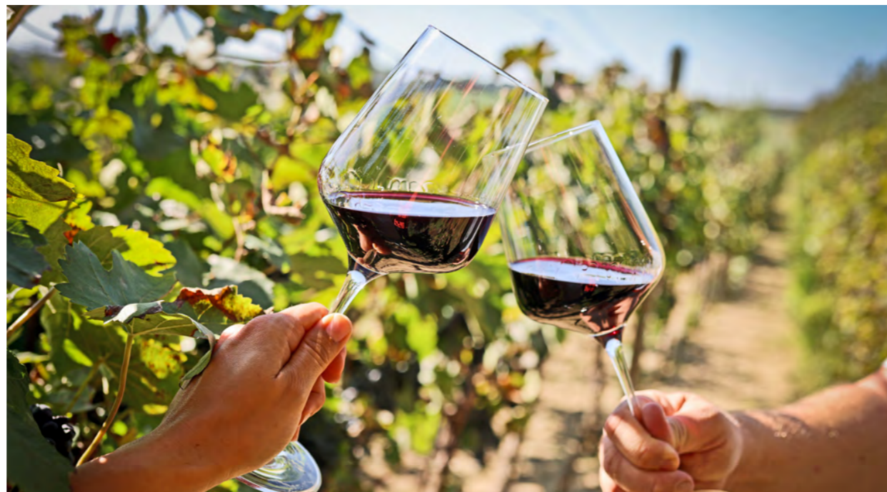
V srdci viníc okolitých chotárov práve dozrieva hrozno, ovocie tvrdej práce tunajších rodín i známych spoločností a stáročnej tradície. Pohár červeného vína nie je len výsledkom oberačiek, ale aj symbolom priateľstva a radosti zo spoločného okamihu.

Prvé písomné záznamy o pestovaní viniča v okolí Serede siahajú do stredoveku. Vďaka svojej polohe pri Váhu a obchodným cestám bola Sereď miestom, kde sa víno nielen vyrábalo, ale aj predávalo ďalej v drevených sudoch priamo