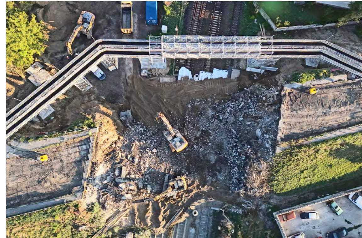
Ráno 4. september: 70-ročný most už bol minulosťou.

Doprastav v priebehu jedného roka. Podľa vyjadrení správcu by nový most mal stáť do leta 2026. Most ponad železniciu, ktorý bol viac ako sedem desaťročí súčasťou každodenného života Sereďčanov, sa stal už len spomienkou. Mnohí obyvatelia si však vydýchli – po rokoch neistoty a provizórii konečne začala nová kapitola, ktorá prinesie mestu bezpečné dopravné spojenie. (red)