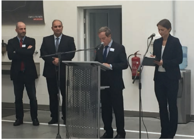
Spoločnosť má dlhoročnú tradíciu. Vznikla v roku 1954 vo Francúzsku, má osem dcérskych spoločností v rôznych