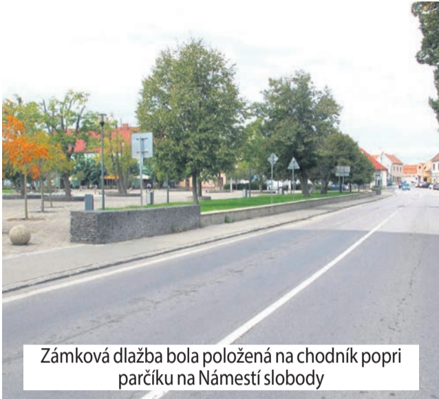
Zámková dlažba bola položená na chodník popri parčíku na Námestí slobody