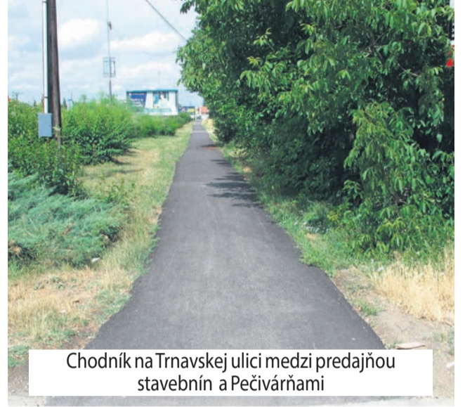
Chodník na Trnavskej ulici medzi predajňou stavebnín a Pečivárňami