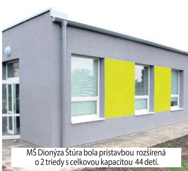
MŠ Dionýza Štúra bola prístavbou rozšírená o 2 triedy s celkovou kapacitou 44 detí.