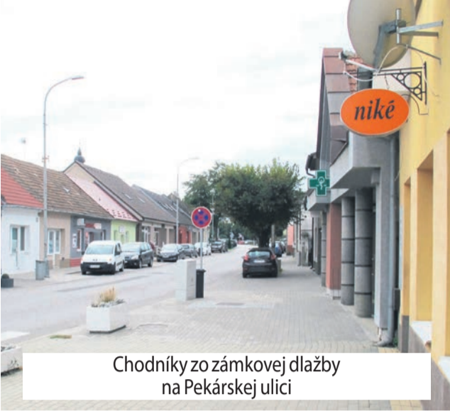
Chodníky zo zámkovej dlažby na Pekárskej ulici