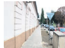
Zo zámkovej dlažby boli urobené obidva chodníky Parkovej ulice