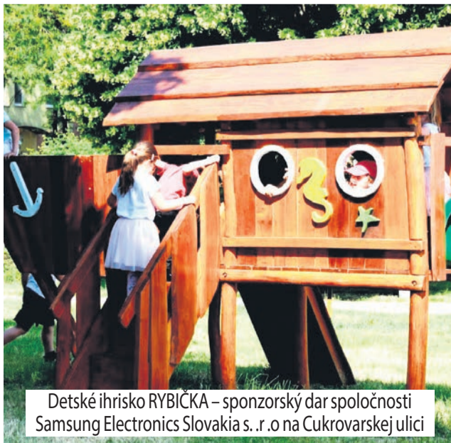
Detské ihrisko RYBIČKA – sponzorský dar spoločnosti Samsung Electronics Slovakia s. r. o na Cukrovarskej ulici