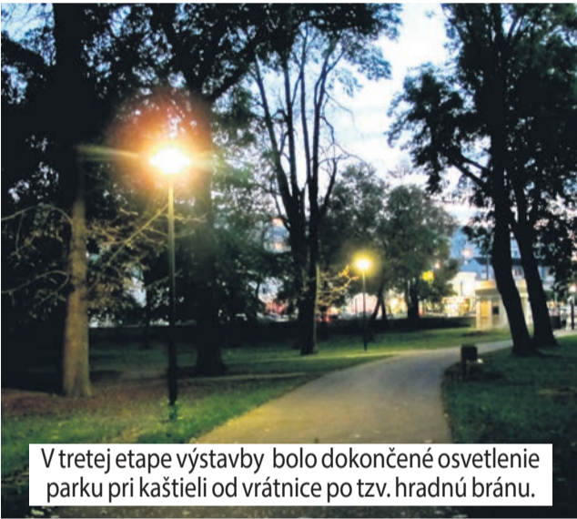
V tretej etape výstavby bolo dokončené osvetlenie parku pri kaštieli od vrátnice po tzv. hradnú bránu.