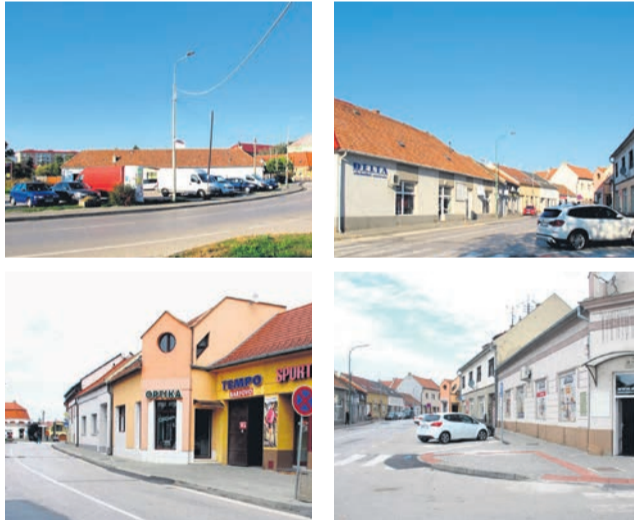
Povrch zo zámkovej dlažby dostali chodníky na ulici SNP