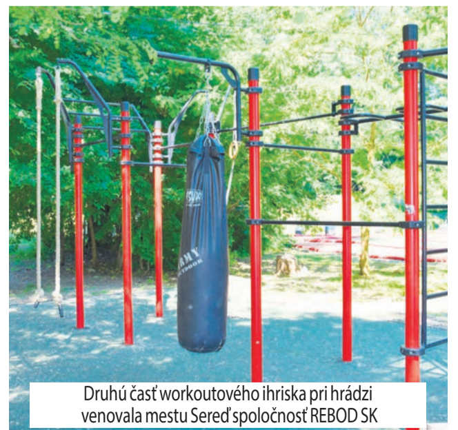
Druhú časť workoutového ihriska pri hrádzi venovala mestu Sered' spoločnosť REBOD SK