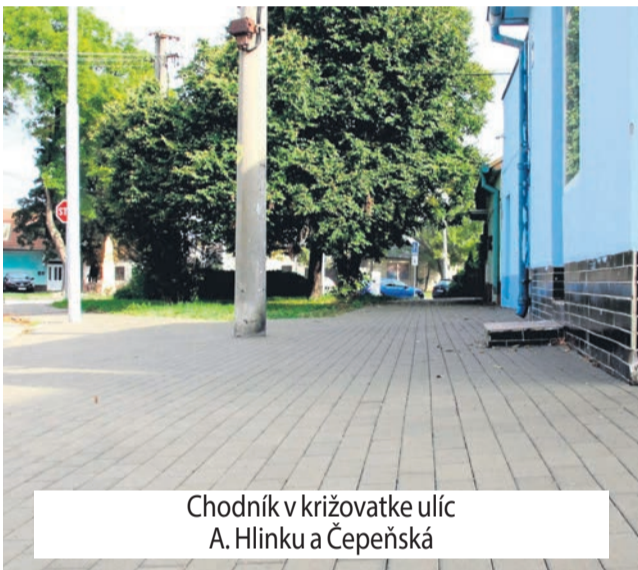
Chodník v križovatke ulíc A. Hlinku a Čepeňská