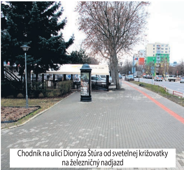
Chodník na ulici Dionýza Štúra od svetelnej križovatky na železničný nadjazd