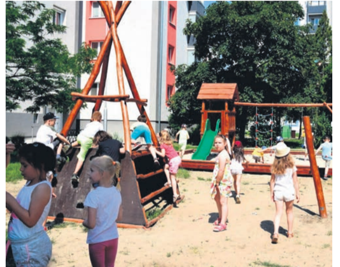
Detské ihrisko INDIÁN – sponzorský dar spoločnosti Samsung Electronics Slovakia s. r. o na Fándlyho ulici