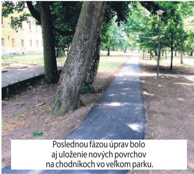
Poslednou fázou úprav bolo aj uloženie nových povrchov na chodníkoch vo veľkom parku.