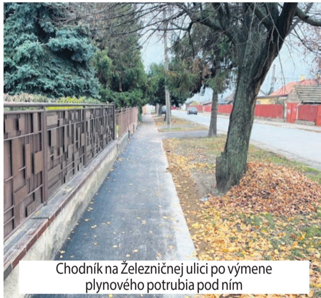
Chodník na Železničnej ulici po výmene plynového potrubia pod ním