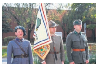
26. októbra 2021 bola na Námestí republiky odhalená replika sochy Legionára.