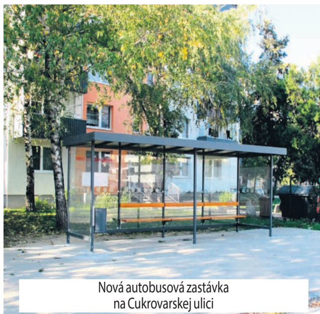
Nová autobusová zastávka na Cukrovarskej ulici