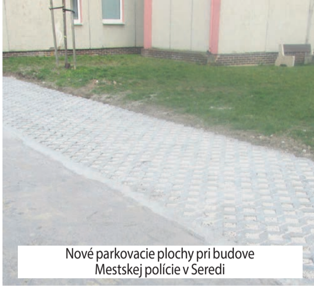
Nové parkovacie plochy pri budove Mestskej polície v Seredi