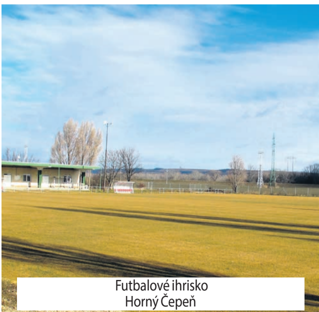
Futbalové ihrisko Horný Čepeň