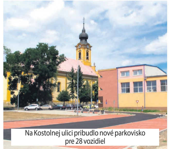
Na Kostolnej ulici pribudlo nové parkovisko pre 28 vozidiel