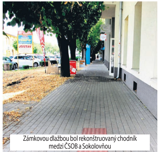
Zámkovou dlažbou bol rekonštruovaný chodník medzi ČSOB a Sokolovňou