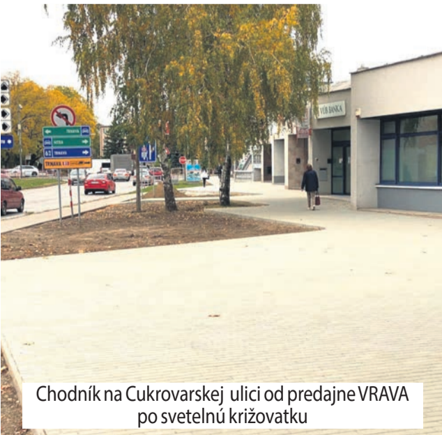
Chodník na Cukrovarskej ulici od predajne VRAVA po svetelnú križovatku