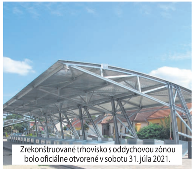
Zrekonštruované trhovisko s oddychovou zónou bolo oficiálne otvorené v sobotu 31. júla 2021.