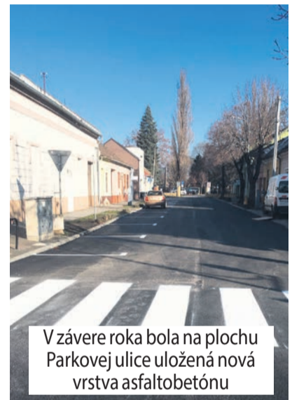
V závere roka bola na plochu Parkovej ulice uložená nová vrstva asfaltobetónu