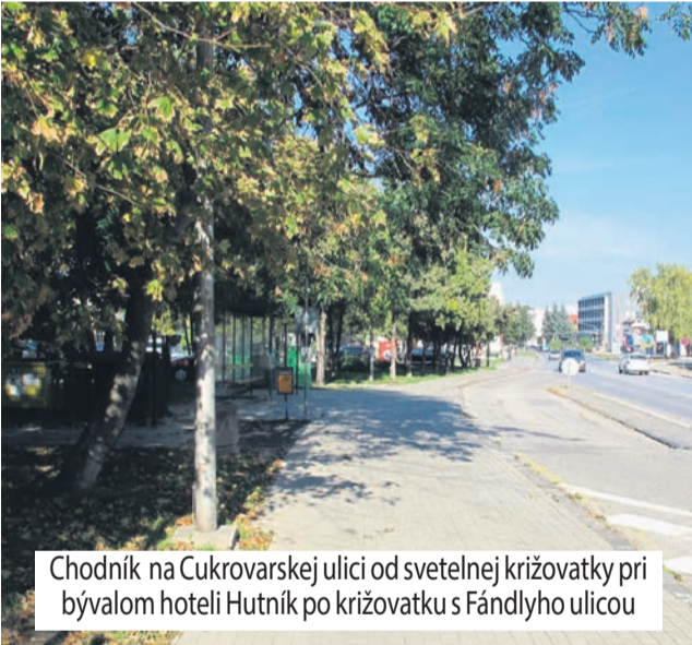
Chodník na Cukrovarskej ulici od svetelnej križovatky pri bývalom hoteli Hutník po križovatku s Fándlyho ulicou