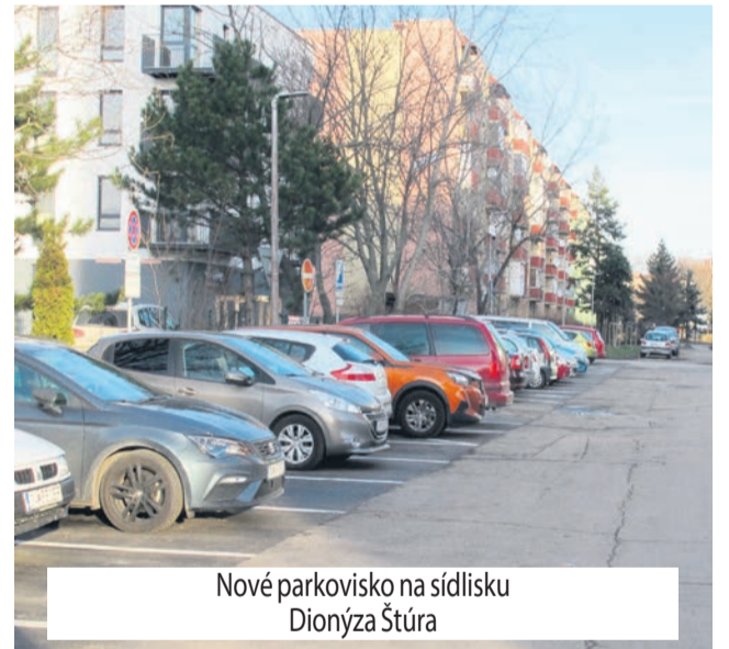
Nové parkovisko na sídlisku Dionýza Štúra